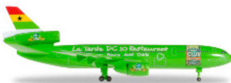
Jetzt neu im Clubshop: DC-10 La Tante DC-10 "Restaurant"