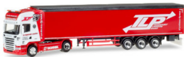
Scania R TL Schubboden-Sattelzug "TLP"

Das Unternehmen TLP wurde im Dezember 2003 gegründet und ist hauptsächlich im nationalen Fernverkehr tätig. Die Transportaufgabengebiete der österreichischen Firma reichen von Paletten-, Baustoff- und Schüttguttransporten über Fertigteil- und Spezialtransporten, bis zur Be- und Entladung mittels LKW-Kran und Ladebordwänden.