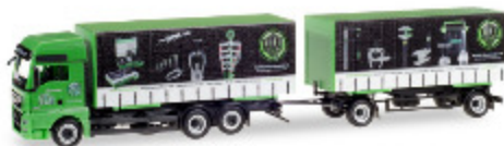
Jetzt neu im Clubshop: MAN TGX XXL Gardinenplanen-Hängerzug "Kukko"