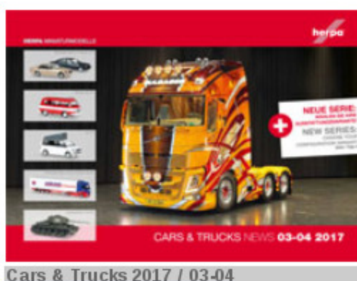
Cars & Trucks 2017 / 03-04

Aus neu entwickelten Formen stammen in diesem Neuheitenprospekt bereits verschiedene Modelle des Airbus A320, die durch verbesserte Qualität auffallen - bei gleich günstigem Preis. Weitere Formen werden derzeit überarbeitet und mit den zukünftigen Neuheiten erscheinen.