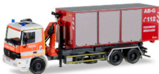
Mercedes-Benz Actros WLF mit Kran Feuerwehr Düsseldorf

Dieses Einsatzfahrzeug der Feuerwehr Düsseldorf wurde detailgetreu dem Vorbild nachproduziert.