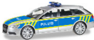
Audi A6 Avant "Autobahnpolizei Sachsen Anhalt"

Tipp: Am besten rufen Sie vor einem Besuch bei Ihrem Fachhändler kurz an und fragen, ob die von Ihnen bestellten Modelle bereits bei ihm angekommen sind - da die Auslieferung an alle Händler aus logistischen Gründen einige Zeit in Anspruch nimmt.